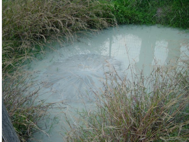
Figura 4. Zona caratterizzata da emissione localizzata (Cellino Attanasio)

evidenti avvallamenti, rigonfiamenti e fratture a varia orientazione (Fig. 5, 6).