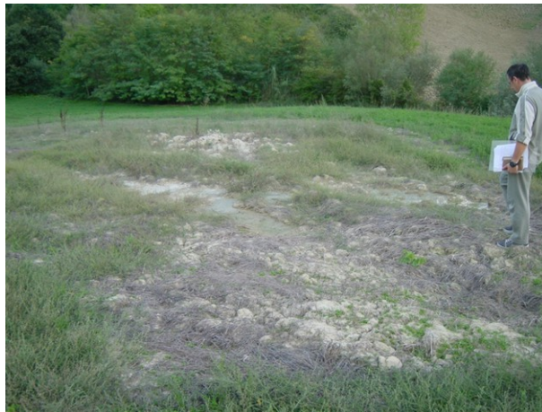
Figura 5. Zona caratterizzata da emissione diffusa (Cellino Attanasio)